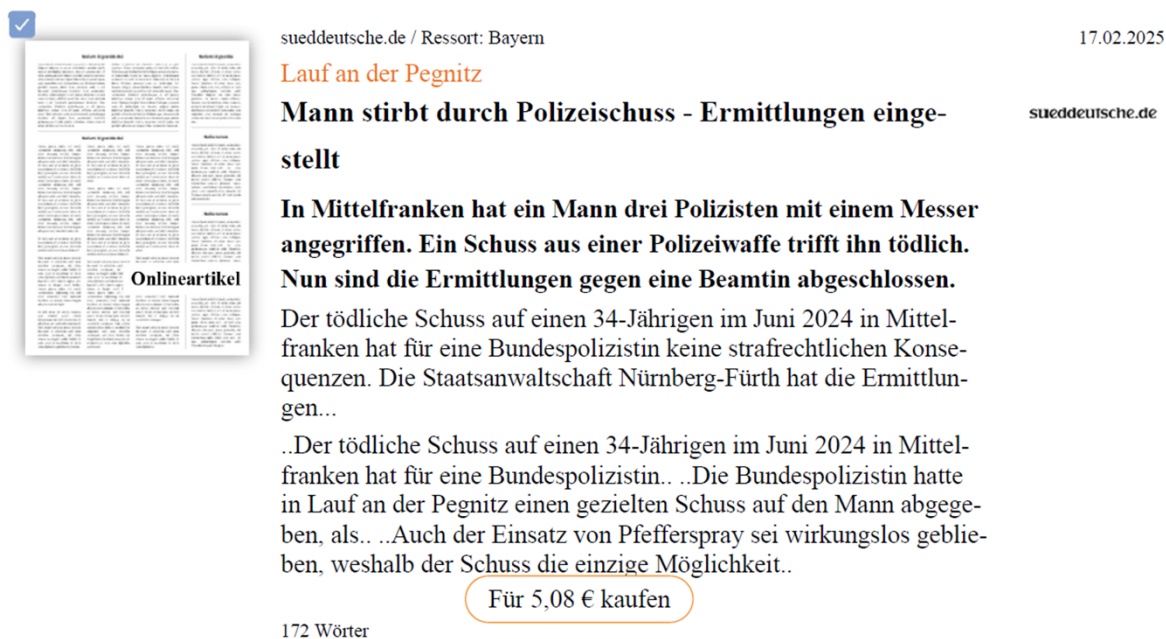
Abbildung 2: Beispiel eines einschlägigen Ergebnisses (Screenshot)

schrift, Leadtext und Haupttext gemeinsam 103 Wörter. Es werden also ca. 60 % des Originaltextes durch den Eintrag abgedeckt. Demgegenüber gibt es andere Beispiele, in denen nur ca. 15 % abgedeckt werden (79 Wörter zu 518 Wörter). Insofern variiert das Verhältnis, insbesondere wenn es sich nicht um Meldungen oder Nachrichten, sondern um Berichte oder Reportagen handelt.